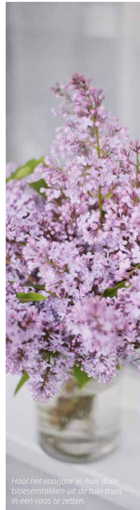
Haal het voorjaar in huis door bloesemtakken uit de tuin thuis in een vaas te zetten.