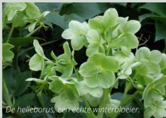
De helleborus, een echte winterbloeier.