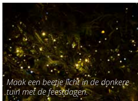
Maak een beetje licht in de donkere tuin met de feestdagen.

Ons Buiten verandert in de winter van een kleurenparadijs in een troosteloze omgeving. Om je tuin een beetje op te leuken, kun je kerstverlichting op zonne-energie ophangen. Een solar kerstslinger bijvoorbeeld, waarbij het