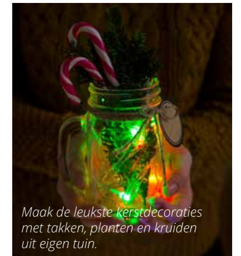
Maak de leukste kerstdecoraties met takken, planten en kruiden uit eigen tuin.

snoeischaar en ga lekker los. Durf je niet, omdat je niet weet wat je wel en niet moet doen? De snoeilessen op Ons Buiten geven inzicht. Zo leer je dat de snoei van de heester niet hetzelfde is als de snoei van een boom en hoe je deze klusjes goed klaart. De vijf snoeilessen van elk twee uur zijn elke tweede zaterdag van de maand van 13.30-15.30 uur: 13 januari, 10 februari, 9 maart, 13 april en afsluiting op 11 mei. Verzamelen bij de kantine. Neem zelf snoeigereedschap mee: snoeischaar, takkenschaar en snoeizaagje. En trek werkkleding en stevige schoenen aan. De lessen zijn gratis en zijn in het park en in de tuinen van de deelnemers. Al je vragen komen aan bod! Vooraf even opgeven bij Gerard Schuitemaker via gangbaar-37@hetnet.nl.