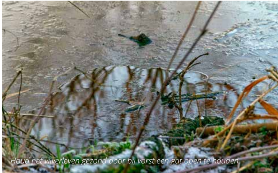
Houd het vijverleven gezond door bij vorst een gat open te houden.

Help flora en fauna in de vijver de winter door. Daarvoor verwijder je oud plantenmateriaal met een hark. Laat het even op de kant liggen, zodat dieren die er nog in verstopt zitten, terug het water in kunnen. Laat je de plantenresten in de vijver, dan gaan deze rotten, wat veel zuurstof kost. Vissen en amfibieën overleven dan de winter niet. Houd bij vorst een gaatje open in het vijveroppervlak,