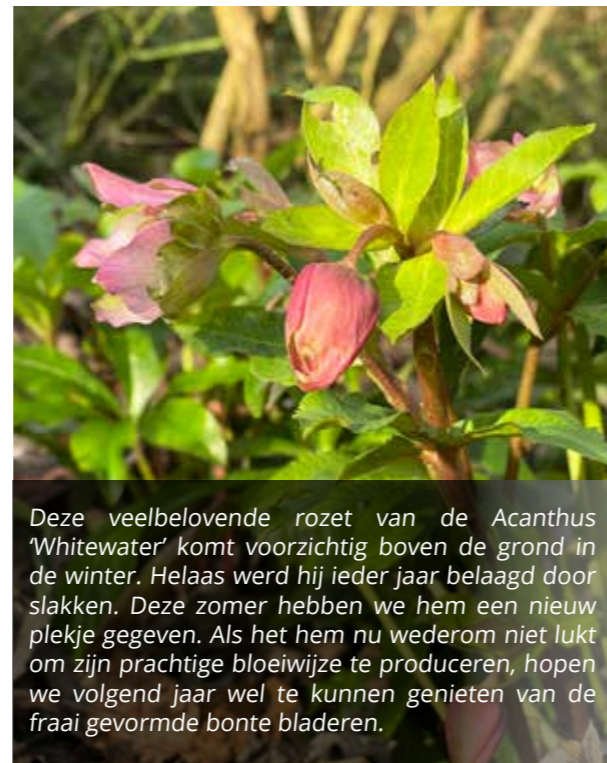
Deze veelbelovende rozet van de Acanthus 'Whitewater' komt voorzichtig boven de grond in de winter. Helaas werd hij ieder jaar belaagd door slakken. Deze zomer hebben we hem een nieuw plekje gegeven. Als het hem nu wederom niet lukt om zijn prachtige bloeiwijze te produceren, hopen we volgend jaar wel te kunnen genieten van de fraai gevormde bonte bladeren.