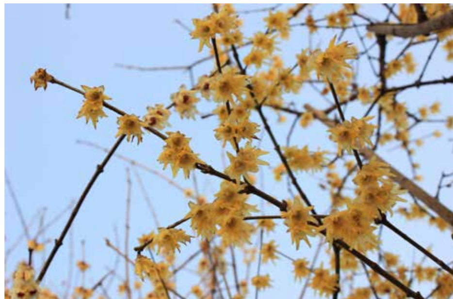
Een van de eerste bloeiers van het jaar is de winterzoet, ook wel meloenboompje genoemd. En het geurt ook nog eens heerlijk.

niet alleen volop in de winter, maar geuren ook heerlijk. Misschien wel het lekkerst (en heel exotisch) geurt de winterzoet (Chimonanthus) met zijn lichtgeel/oranje bloempjes met paarse harten aan de kale takken. Sfeer op het terras en in huis brengt je door een schaal op te maken