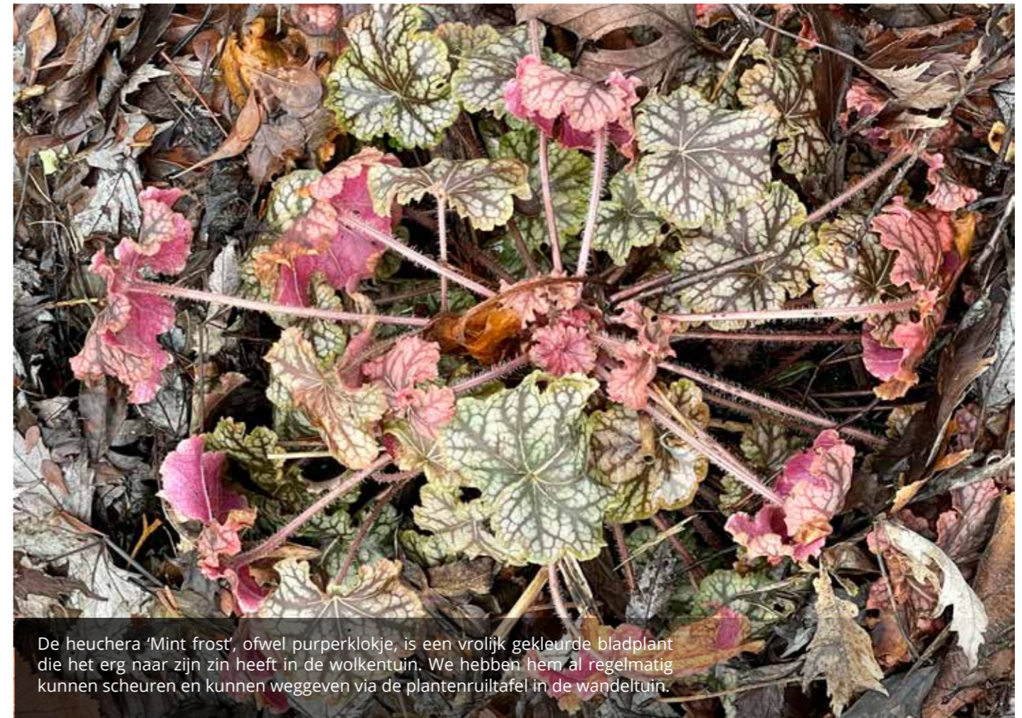
De heuchera 'Mint frost', ofwel purperklokje, is een vrolijk gekleurde bladplant die het erg naar zijn zin heeft in de wolkenuin. We hebben hem al regelmatig kunnen scheuren en kunnen weggeven via de plantenruiltafel in de wandeluin.