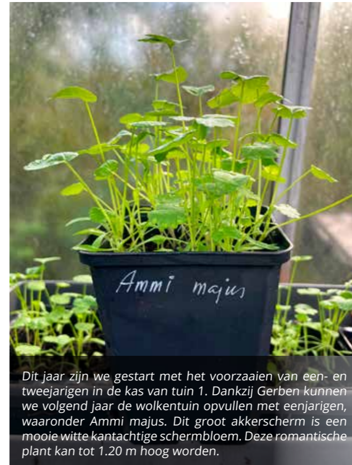
Dit jaar zijn we gestart met het voorzaaien van een- en tweejarigen in de kas van tuin 1. Dankzij Gerben kunnen we volgend jaar de wolkenuin opvullen met eenjarigen, waaronder Ammi majus. Dit groot akkerscherm is een mooie witte kantachtige schermbloem. Deze romantische plant kan tot 1,20 m hoog worden.