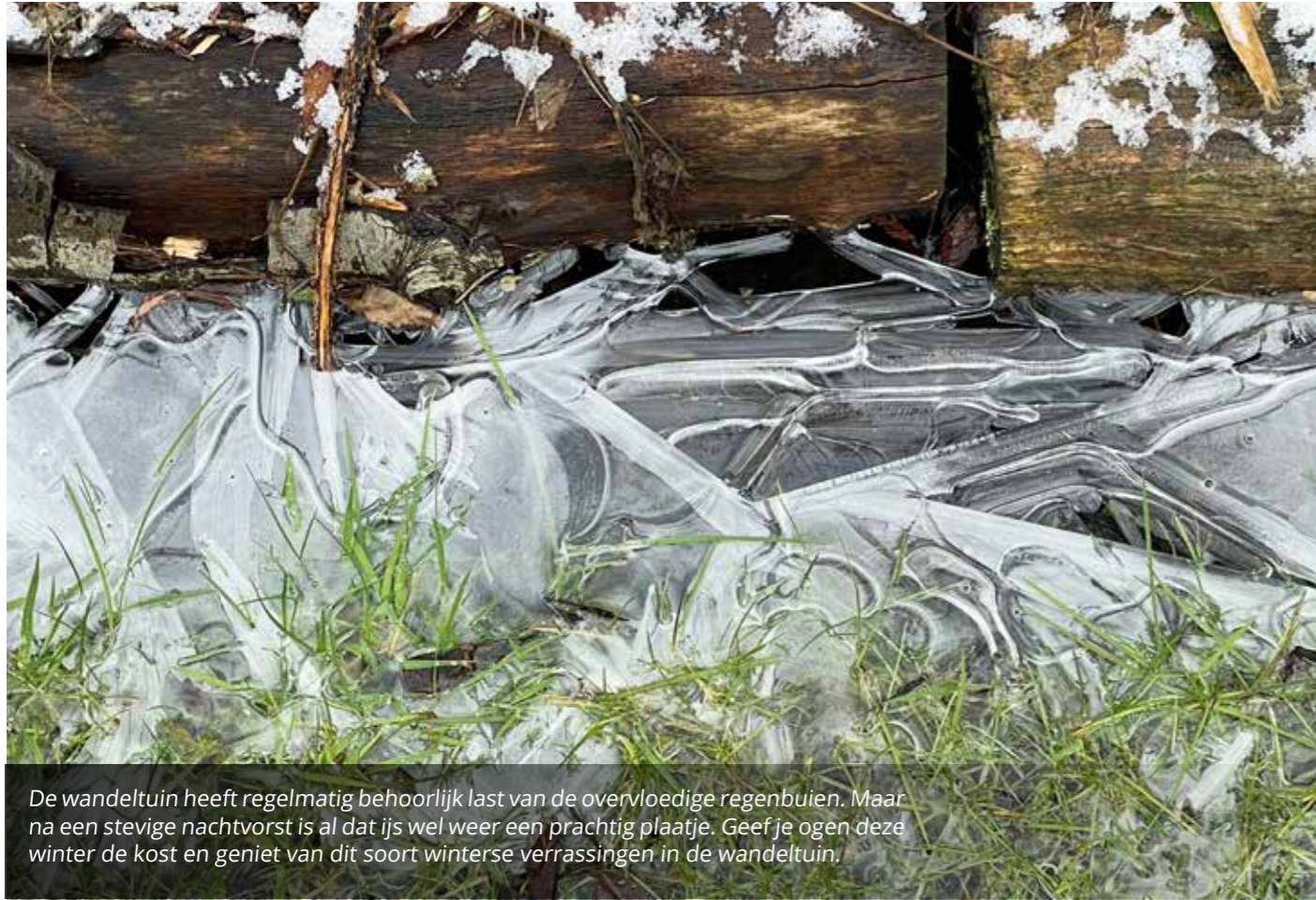
De wandeluin heeft regelmatig behoorlijk last van de overvloedige regenbuien. Maar na een stevige nachtvorst is al dat ijs wel weer een prachtig plaatje. Geef je ogen deze winter de kost en geniet van dit soort winterse verrassingen in de wandeluin.

Beeld: Claudie de Cleen en tekst: Pjer Vriens