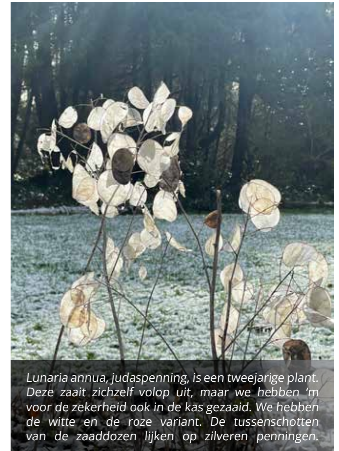
Lunaria annua, judaspenning, is een tweejarige plant. Deze zaait zichzelf volop uit, maar we hebben 'm voor de zekerheid ook in de kas gezaaid. We hebben de witte en de roze variant. De tussenschotten van de zaaddozen lijken op zilveren penningen.