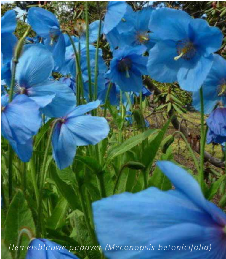
Hemelsblauwe papaver ( Meconopsis betonicifolia )