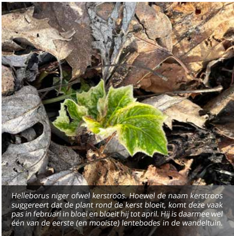
Helleborus niger ofwel kerstroos. Hoewel de naam kerstroos suggereert dat de plant rond de kerst bloeit, komt deze vaak pas in februari in bloei en bloeit hij tot april. Hij is daarmee wel één van de eerste (en mooiste) lentebodes in de wandeluin.