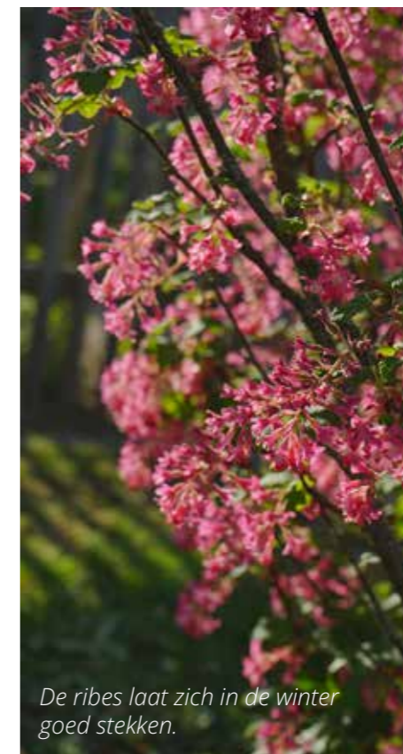
De ribes laat zich in de winter goed stekken.

Met winterstekken kun je goedkoop je favoriete bomen, struiken en planten vermeerderen. Deze stekken neem je in de winter of in het vroege voorjaar, voordat het nieuwe blad verschijnt. Gebruik gezonde, sterke takken - de dikte is de omvang van een potlood. Knip hem af boven een oog (ofwel een knop). Doe dit niet tijdens vorst of