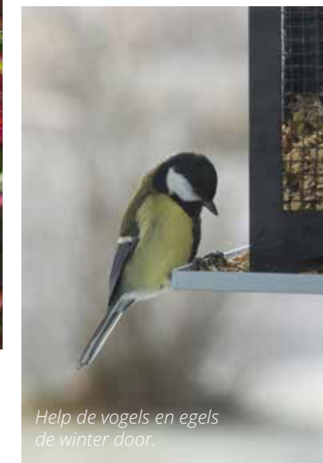
Help de vogels en egels de winter door.

Denk om de vogels en egels door ze bij te voeren. Als de diertjes weten waar ze voer kunnen halen, krijg je de hele winter vaste gasten in de tuin. Een schaalje water wordt ook gewaardeerd, maar houd het wel vorstvrij. Je kunt nu de nestkastjes schoonmaken met warm water zonder zeep. Hang ze terug; vogels gebruiken ze om te overnachten bij kou of storm. Vul de kastjes niet met nestmateriaal. Door ze leeg te laten, kunnen meer vogels bij elkaar in het kastje en houden ze elkaar warm. Hang de