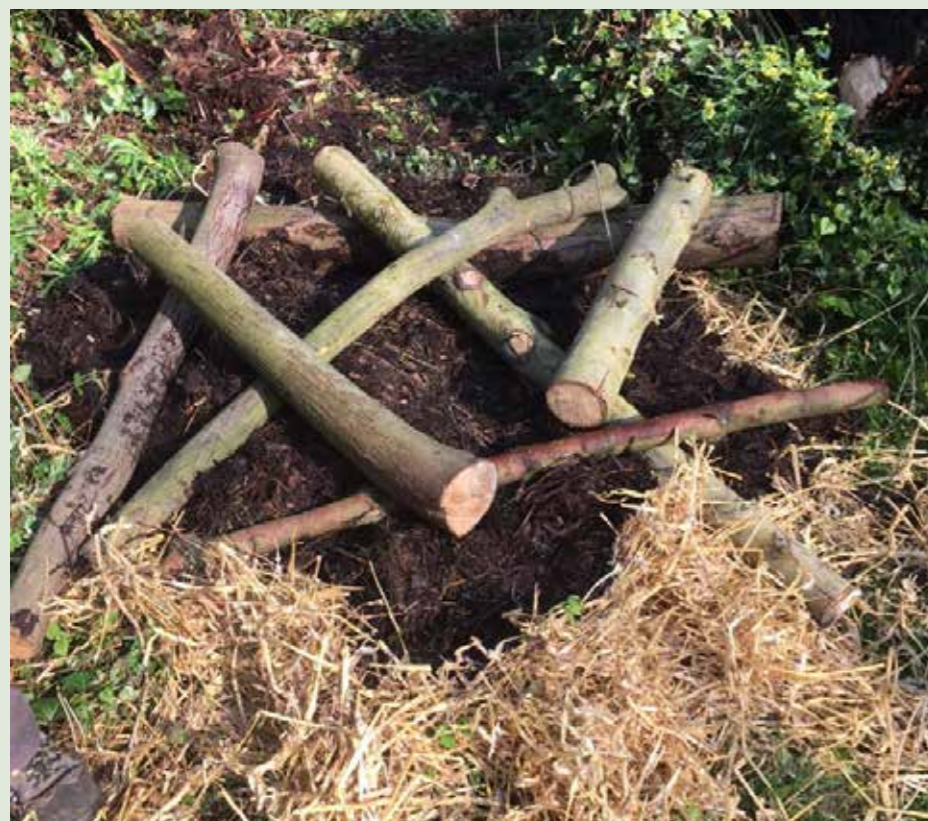
Kruislings gelegde stammetjes zorgen voor lucht en ruimte