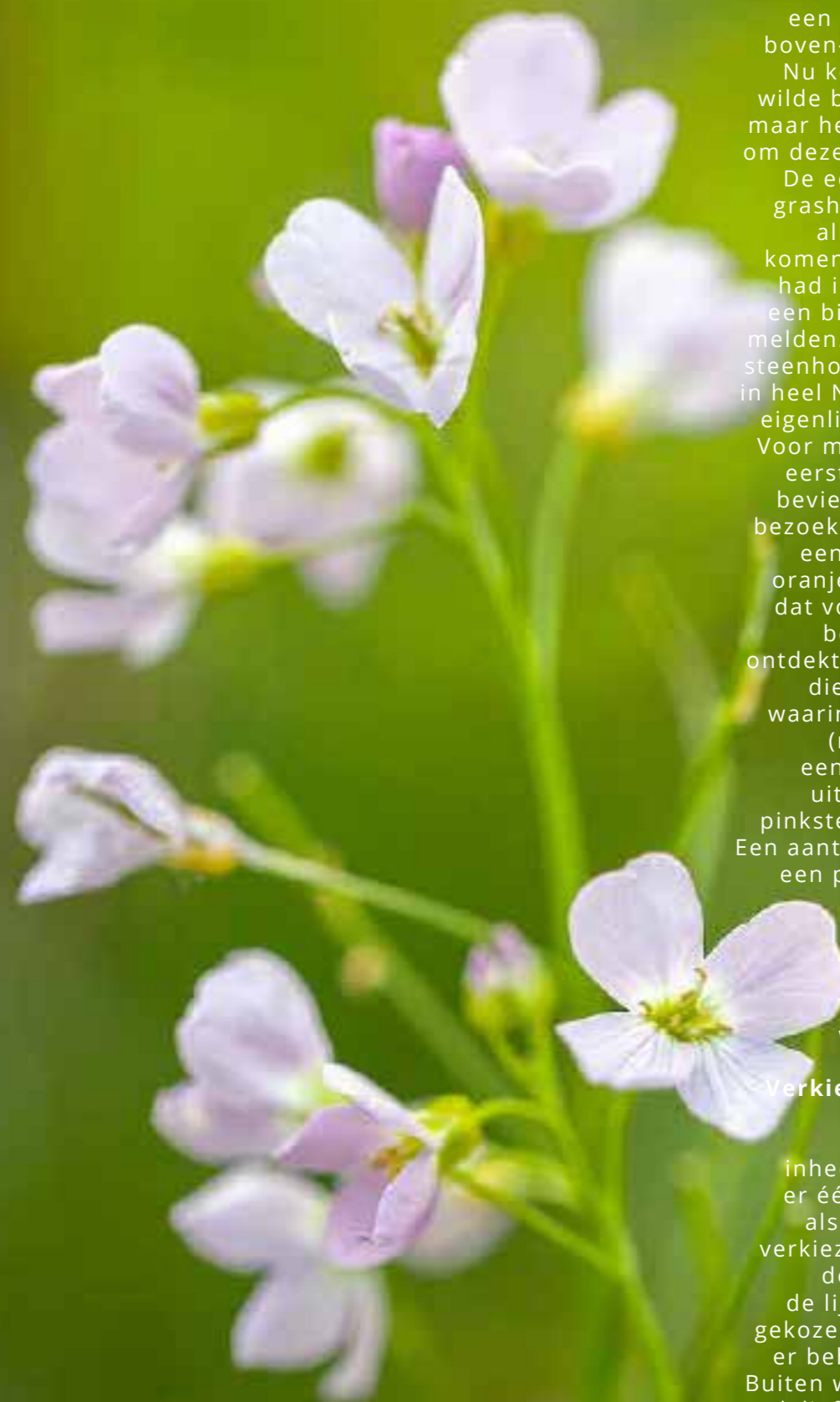
Pinksterbloem (Cardamine pratensis)

Ja, de afgelopen maanden was het regenachtig. Volgens de meteorologen kwam er twee keer zoveel hemelwater naar beneden als gemiddeld in het voorjaar. In onze vochtige veengrond verdween niet alle regen onmiddellijk in de bodem, waardoor tuinieren er niet aldoor in zat. Bij stijgende temperaturen werd het in april toch regelmatig aardig weer en omdat ik zonnige dagen beter onthou dan sombere, denk ik niet alleen maar 'wat een snertvoorjaar'. De laatste dagen van april was het uitbundig zonnig en deze zal ik zeker onthouden als topdagen. Ik zag toen namelijk twee voorbijgangers die ik nog nooit eerder had waargenomen in mijn tuin.