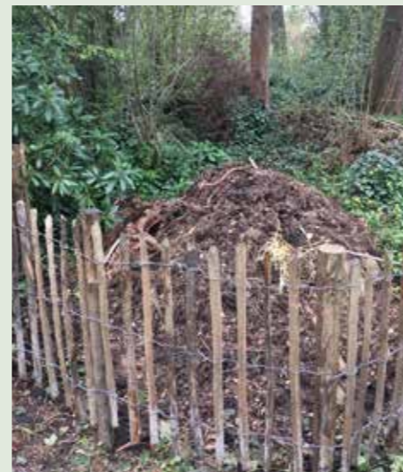
Een schapenhek ervoor en klaar

het juiste mengsel daarvoor ontvangen. Op een mooie warme zaterdagochtend hebben tuinbeurters de eerste broeihoop noordelijk van het Nieuwe Meer aangelegd en wel aan het einde van de wandeltuin aan onze Zuidsingel. Recept voor een goede broeihoop: laagje stront-stromengsel, dikke takken kruislings daarop, laagje mengsel, takken, laagje mengsel en zo verder tot er een fraaie broeihoop ligt. Schapenhekje ervoor en klaar.