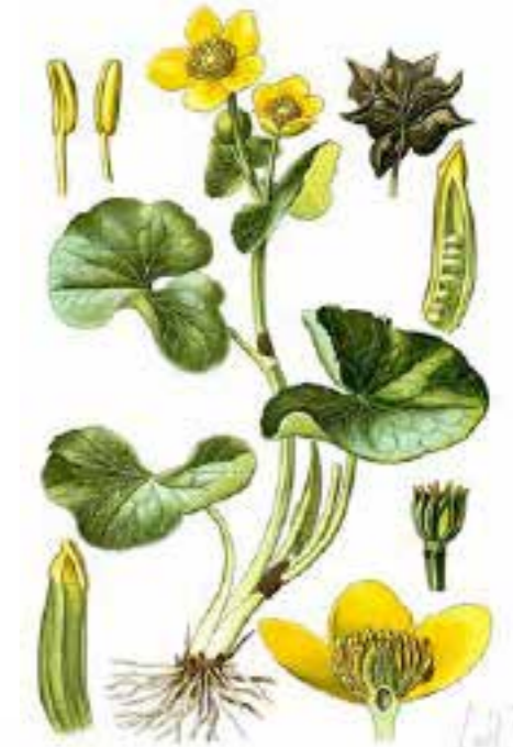
Gewone dotterbloem (Caltha dissectum)

Viel er tussen alle bloemen uit de lijst van kandidaten voor de verkiezing van nationale bloem nog op deze of gene fraaierling (geen Nederlands, dus een nieuw woord) te kiezen? Ja zeker, de dotterbloem moet spoorlags aan mijn slootkant een plaatsje krijgen.