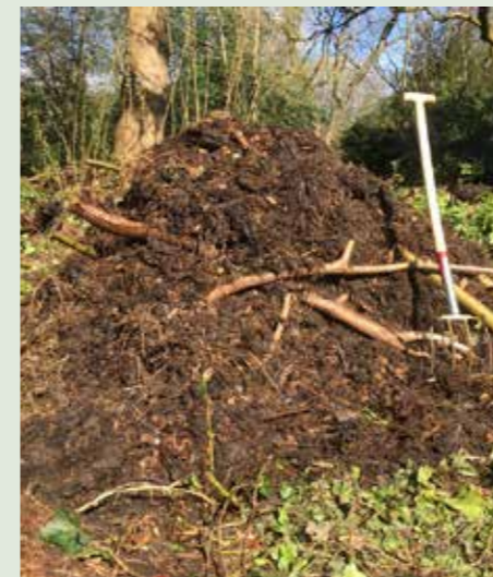
De broeihoop is klaar voor gebruik