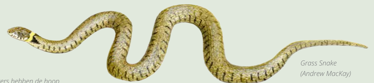
Grass Snake (Andrew MacKay)