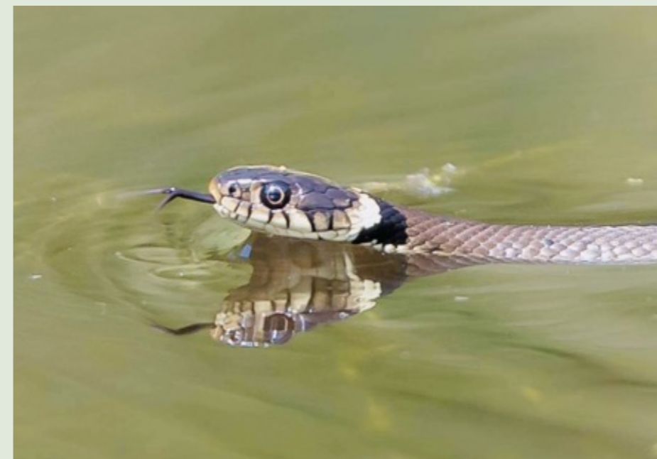
Ringslangen zijn uitstekende zwemmers

Tegenwoordig horen daar ook DNA-technieken bij om verwantschappen te kunnen onderzoeken. Ringslangen komen nog niet eens zo lang voor op Marken. Mede dankzij de aanleg van broeihopen heeft de ringslang zich in de loop der jaren helemaal tot aan vuurtoren 'het Paard' weten uit te breiden. En daar gaan we naartoe. Het is begin april, voorjaar dus. De wind is guur, een dun zonnetje dient zich aan. Overal zien we grutto's, wulpen, krakeenden en andere vogels.