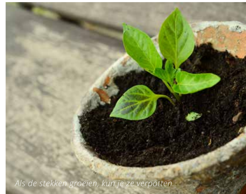
Als de stekken groeien, kun je ze verpotten.

Juni is hét moment voor het nemen van zomerstekken; dat zijn stekken met blad. Heesters en kruidachtige