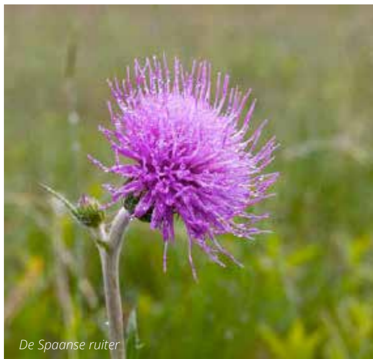
De Spaanse ruiter

In de lijst ging ik op zoek naar een oranje bloem, maar alleen de roggelelie bleek oranje en dat is geen bloem met nationale bekendheid. Hetzelfde geldt voor de Spaanse ruiter, die we zouden kunnen kiezen omdat we volgens ons volkslied de koning van Hispanje altijd geëerd hebben. Dat was alleen lang geleden en we zijn al in 1648 door de Spaanse koning als vrije staat erkend. Riet is een