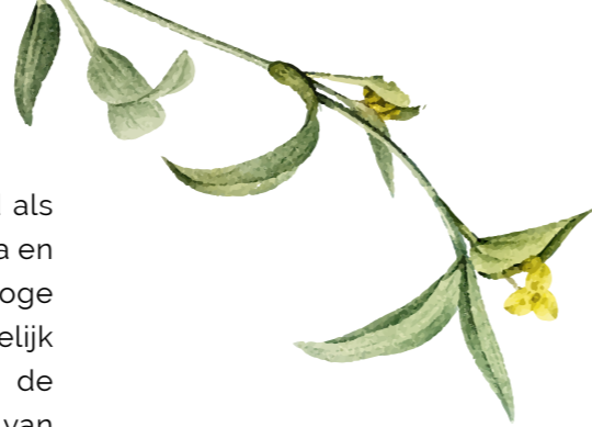
Planten met grote bladeren kunnen flink vocht verdampen