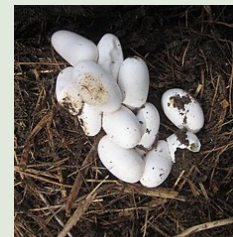
De eieren van de ringslang zijn (vuil)wit van kleur

Zoals alle reptielen is de ringslang een koudbloedig dier dat op vorstvrije plekken onder andere in dijken en spoortaluds overwintert (oktober-maart). De slangen houden van het zonnetje om op te warmen. Stenige zandlichamen zoals dijken en taluds zijn ideaal voor de dieren. Uitgebreide veengebieden zijn minder gunstig, omdat niet alle stadia van de levenscyclus goed doorlopen kunnen worden. Overgangen van veengebieden en zand/kleigebieden zijn weer wel lekker. De ringslang is vooral aanwezig in drie min of meer gescheiden kernen die in een ruim gebied rondom het IJsselmeer liggen.