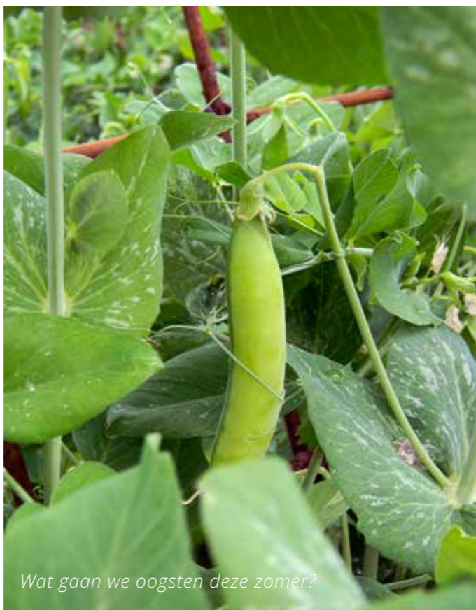
Wat gaan we oogsten deze zomer?