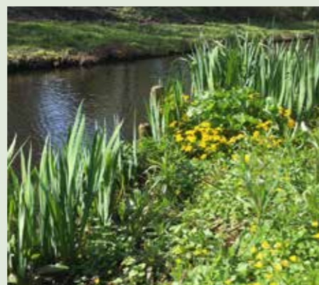
De oeverbeschoeiing is al jaren geschikt voor passage van de ringslang