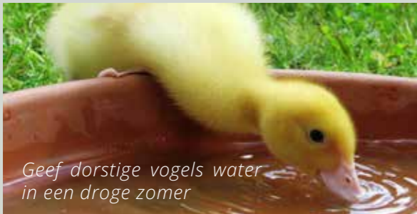
Geef dorstige vogels water in een droge zomer