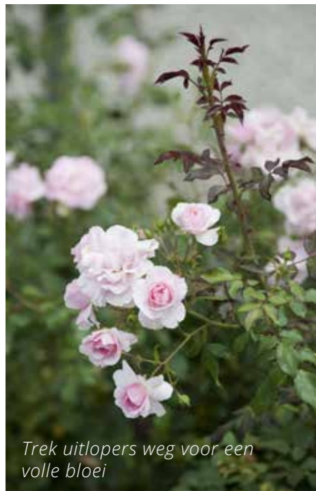
Trek uitlopers weg voor een volle bloei