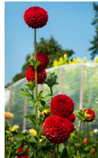
Dahlia's voor een deel ingekort