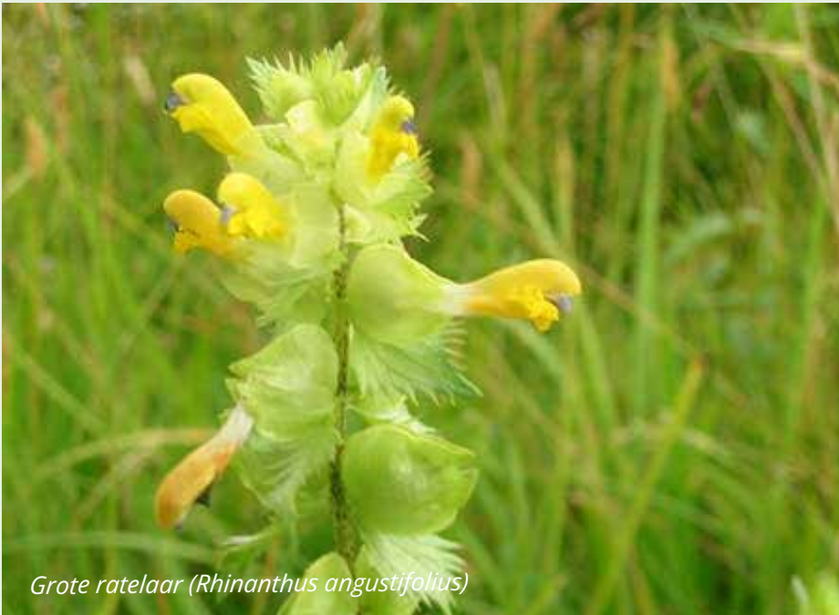
Grote ratelaar (Rhinanthus angustifolius)