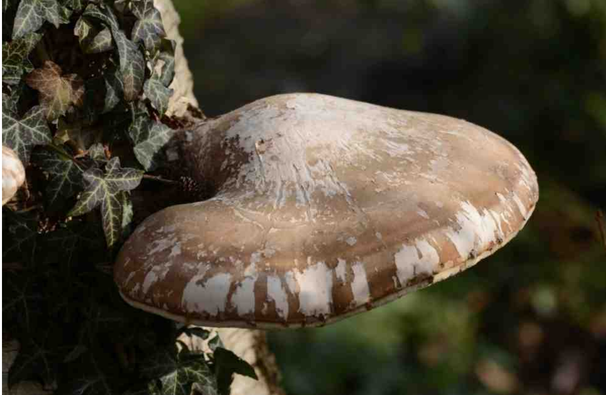
Bekermos aan de voet van een berkenstam, bloeiende mahonie en berkenzwam (ten onrechte ook wel berkendoder genoemd).

deren zijn acht of negen jaar en hebben nu al een blauwe flits gezien.