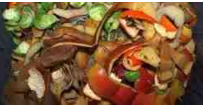
Van links onder naar rechtsboven: dit wil je graag zien op je composthoop: