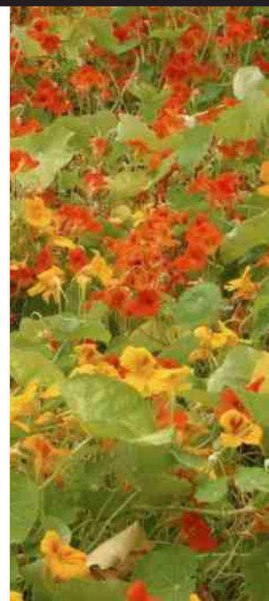
compostwormen; kukelende haan op oude composthoop; geschikt groente- en fruitafval; roodborst pikt een wormpje mee; mooie bruine rat; hulp in de hoop pissebed; eetbare Oost-Indische kers.

Heb je nu de composthoop gevuld, dan is het zaak de boel te beschermen tegen uitdroging, maar ook tegen te veel vocht. Voelen en ruiken helpt daarbij. Dus een gietertje water eroverheen als het te droog wordt en afdekken tegen overvloedige regenval. Verder moet je af en toe de boel keren; binnen wordt buiten en boven wordt onder bij het overschepen naar de tweede bak. Je kunt de composthoop ook laten overgroeien met bijvoorbeeld een Oost-Indische kers. De bloemen worden door hommeltjes bezocht en zijn voor ons ook eetbaar.