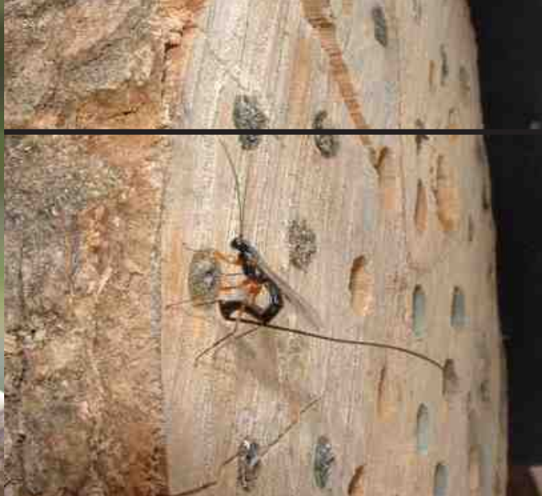
Roodborstje (Erithacus rubecula). Rechts zien we de sluipwesp.

positief over het enthousiasme van de cursus-leidster Roos Broersen, die tevens ter zake kundig en humoristisch werd bevonden. Men was over het algemeen zeer tevreden over de hoeveelheid theorie per avond, de aanvangstijd (19.45 uur), de cursusduur (twee uur per avond), de kosten (dertig euro), en de groepsgrootte (dertig deelnemers). De deelnemers waren verdeeld over wat de beste periode in het jaar is om deze cursus aan te bieden. De zomerperiode (derde kwartaal) kreeg het minste aantal stemmen, terwijl de andere kwartalen even hoog scoorden. Een aantal tuinders gaf aan het jammer te vinden dat de cursus nu in de herfst gegeven is, omdat er aansluitend niet zo veel te doen zou zijn in de eigen tuin. De deelnemers vonden de drie hoofdonderdelen van de cursus, te weten Bodem/Algemeen, Composteren en Ziekten en Plagen, (zeer) zinvol. De aandacht voor onkruiden en invasieve exoten werd zeer op prijs gesteld, evenals de focus op veengrond. Over de hand-outs was men wat minder tevreden; men had verwacht de diapresentatie integraal toegestuurd te krijgen. Een enkeling zou graag aantekeningen hebben gekregen van de uitgesproken tekst. Een enkele deelnemer vond dat er te veel tijd voor vragen was, terwijl an-