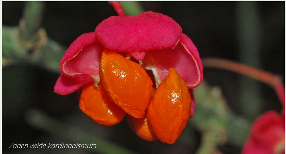
Zaden wilde kardinaalsmuts

Het tuinyforestpakket is inmiddels besteld en wordt in november van dit jaar aangeplant. Dit pakket bevat overigens niet alleen bomen en struiken, maar ook een zadenmix van zevenentwintig verschillende vaste en eenjarige planten, zoals gewone ossentong, vertakte leeuwentand, akkerklokje, muskuskaasjeskruid, lange ereprijs en zwarte toorts. Omdat elke tuin weer anders is, zal het per tuin verschillen welke planten uit de mix goed aanslaan. Daarom zitten er ook zo veel verschillende soorten in; zo is de slagingskans voor elke tuin lekker groot. In november dus aan de slag met planten, zaaien, water geven en daarna ongeduldig afwachten.