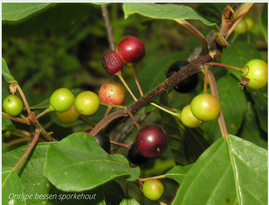
Onrijpe bessen sporkehout