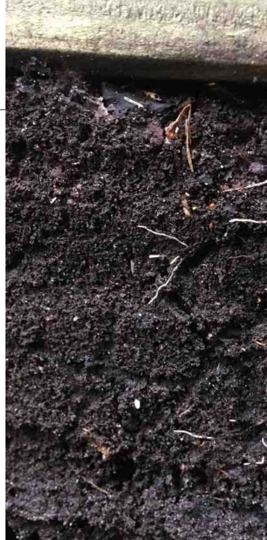
Vier paaltjes, gaas eromheen en je hebt al een simpele composthoop.